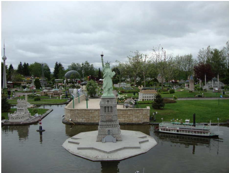
Kip slobode, New York