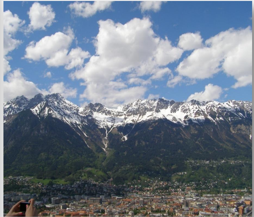
Pogled sa skakaonice