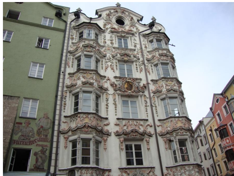
Najljepša zgrada u Europi