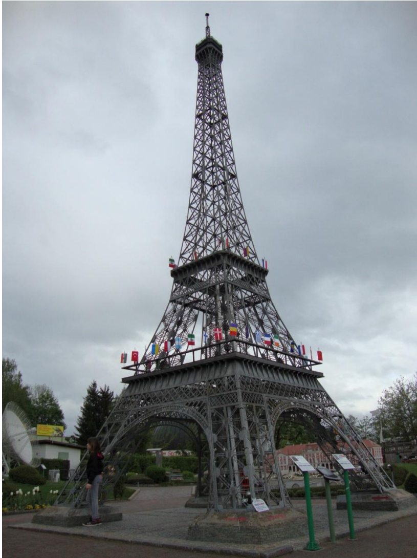
Eiffelov toranj, Pariz